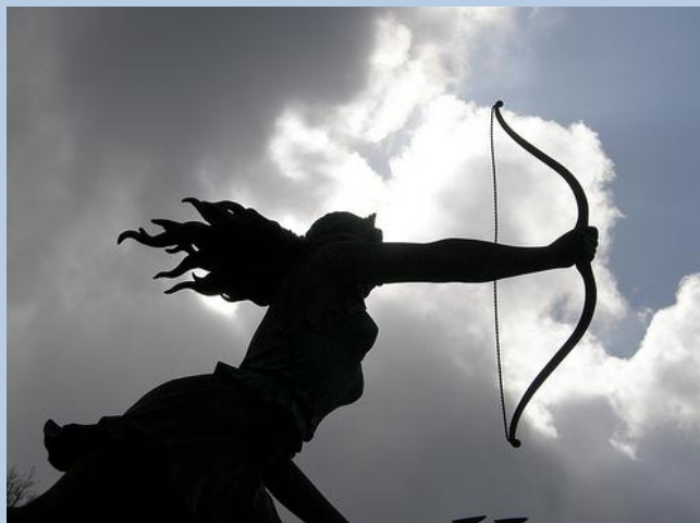
Fontana di Diana, di L. Mastrolorenzi, Nemi

Far conoscere il territorio di Nemi, la sua poesia e la sua bellezza, anche a coloro che non hanno ancora avuto la possibilità di farlo, è l'intento dell' Associazione Aeneas Onlus.